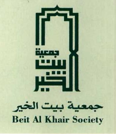
"جمعية بيت الخير" تكرم موظفيها