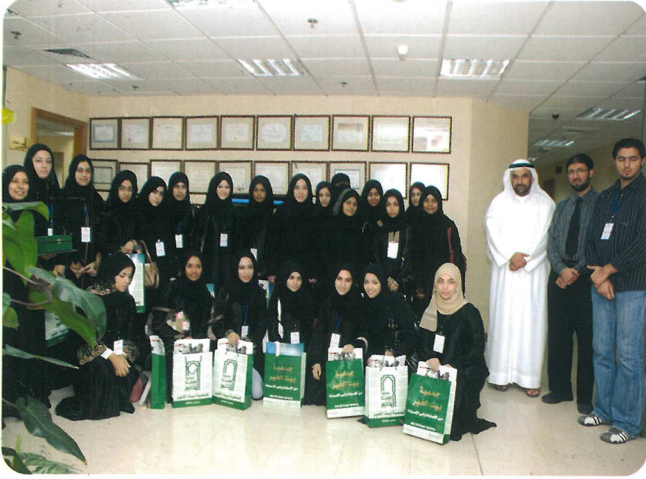
صورة جماعية للوفد