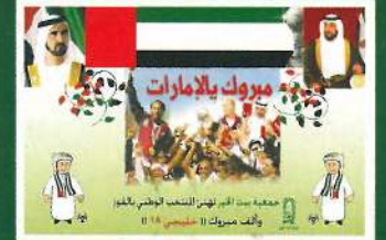
02 ألف مبروك بفوز المنتخب الوطني