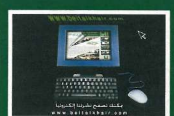
06 تصفح النشرة إلكترونياً