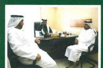
05 وفد من مؤسسة زايد بن سلطان