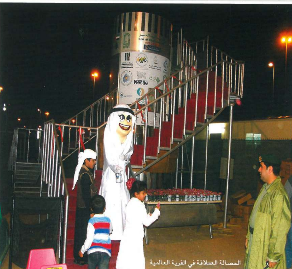
الحصالة العملاقة في القرية العالمية