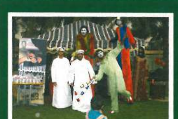
07 اليوم المفتوح في مدينة دبي للإعلام