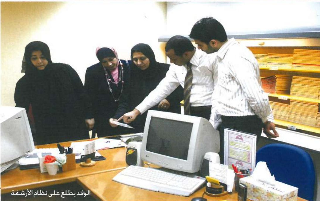
الوفد يطلع على نظام الأرشفة

قام وفد من مركز جمعة الماجد بزيارة بيت الخير وذلك للتعرف على نظام الأرشفة فيها وعلى النظم الإلكترونية المستخدمة في الجمعية واطلع على سياسة بيت الخير في الأرشفة ودراسة الحالات ودورة ملف الحالة. كما اطلع الوفد على الأرشفة الخاصة بقسم الإعلام والأخبار بالإضافة إلى الصور وطريقة أرشفتها والموقع الإلكتروني. وكانت الجمعية قد أطلقت نسختها المطورة للموقع الإلكتروني الخاص بها خلال الشهر الماضي، ويحتوي على العديد من الصفحات ومنها صفحة مجلة الجمعية وصفحة الأقسام والأفرع وصفحة مجلس الإدارة وصفحة المشاريع والبرامج التي تقدمها الجمعية والأنشطة والفعاليات، إضافة إلى سجل الزوار وصور فيديو وطريقة الاتصال بالجمعية. وقد قامت إدارة موقع الجمعية بتجميع جميع الأخبار والفعاليات الخيرية الخاصة بالجمعية ووضعها على الموقع، كما قام قسم الكمبيوتر وبالتعاون مع قسم الإعلام بالجمعية بوضع جميع الأخبار والفعاليات الخيرية على مدار الأسبوع بموقع الجمعية الإلكتروني www.beitalkhair.com . ويتيح الموقع استقبال الاستفسارات والاقتراحات ومشاريع الجمعية، مع إرسال النشرة الشهرية لجميع مستخدمي وزوار الموقع عبر البريد الإلكتروني ليتسنى لهم متابعة أخبار الجمعية.